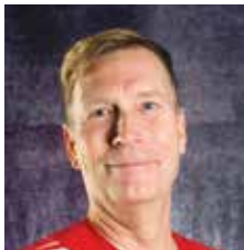
VALMENTAJA U11 MINIPOJAT