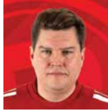
VALMENTAJA MIESTEN KORISLIIGA