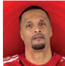
VALMENTAJA AKATEMIA A+B