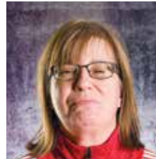
JOUKKUEENJOHTAJA UNIFIED 2. DIV.