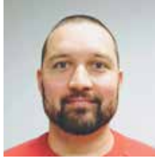
VALMENTAJA U10 MIKROPOJAT