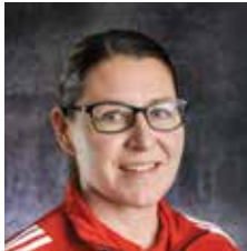
2. JOUKKUEENJOHTAJA U13