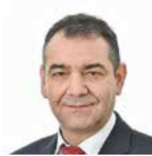
VALMENTAJA U8-7 SUPERMIKROT