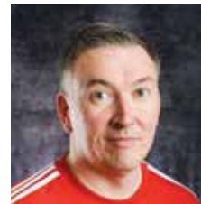
VALMENTAJA NAISET WU19-17