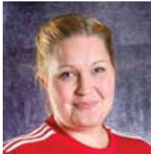
VALMENTAJA U9 MIKROPOJAT