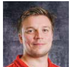
VALMENTAJA U19-17, U16-15 U9 MIKROPOJAT