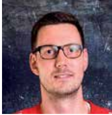
VALMENTAJA U8-7 SUPERMIKROPOJAT