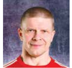
FYSIIKKAVALMENTAJA U19-17 U16-15