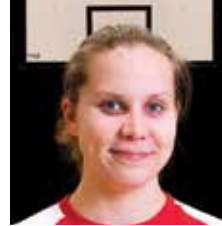
VALMENTAJA NAISET HARRASTE