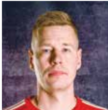
VALMENTAJA U12 MINIPOJAT