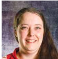
VALMENTAJA U12 MINIPOJAT