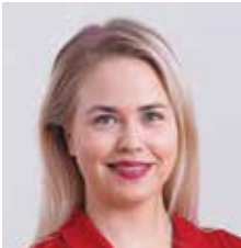
VALMENTAJA WU19 FUN