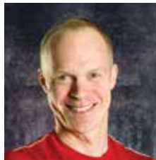
VALMENTAJA U10 MIKROPOJAT