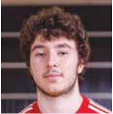
VALMENTAJA U19-17 HARRASTE