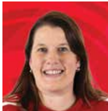
JOUKKUEENJOHTAJA MIESTEN KORISLIIGA MIEHET 1.DIV., AKATEMIA A