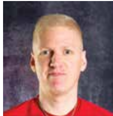
VALMENTAJA U11 MINIPOJAT