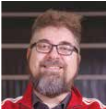
JOUKKUEENJOHTAJA U19-16 HARRASTE