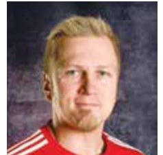
VALMENTAJA U10 MIKROPOJAT