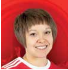
FYSIIKKAVALMENTAJA MIESTEN KORISLIIGA