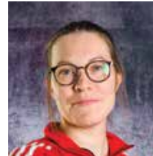
VALMENTAJA WU8-7 SUPERMIKROT