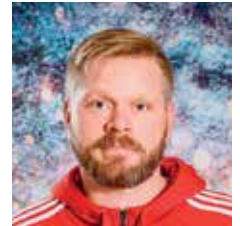
JOUKKUEENJOHTAJA NAISET KL / 1. DIV.