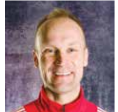
VALMENTAJA U8-7 SUPERMIKROT WU8-7 SUPERMIKROT